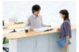
オススメアイテム