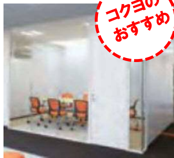
オススメアイテム 間仕切り