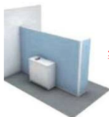
オススメアイテム